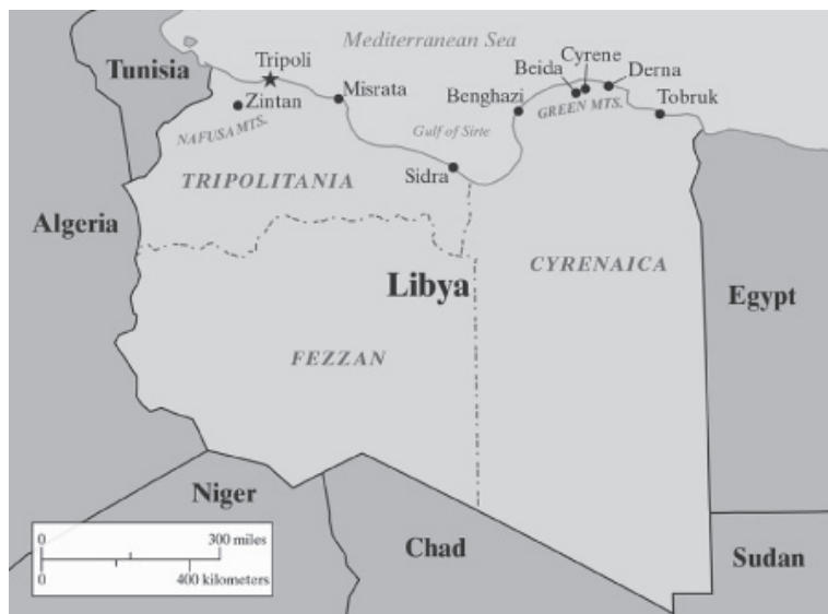
Рис. 1. Исторические области Ливии.

Ливия – это самая восточная страна Магриба, которая исторически делится на три области (см. рис. 1). Триполитания (Тарабулус) располагается на побережье Средиземного моря на северо-западе страны. Киренаика (Барка) располагается на побережье на северо-востоке, однако позже в неё стали включать Ливийскую пустыню, северную часть Сахары, которая простирается далеко на юг от исторической Киренаики вдоль границы с Египтом. Феццан (Фаззан) является самой малонаселённой областью, располагающейся на юго-западе страны и не имеющей выхода к морю.